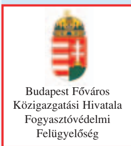
Budapest Főváros Közigazgatási Hivatala Fogyasztóvédelmi Felügyelőség

A törvény új fogalomként meghatározza a díjfizető fogalmát. E szerint díjfizető épületrészenkénti díjmegosztás esetén az épületrésznek a közüzemi szerződésben megnevezett tulajdonosa, vagy meghatározott esetekben az épület, építmény vagy az épületrész bérlője, használója.