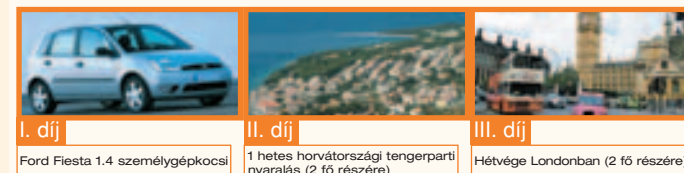
I. díj Ford Fiesta 1.4 személygépkocsi II. díj 1 hetes horvátországi tengerparti nyaralás (2 fő részére) III. díj Hétvége Londonban (2 fő részére)

Értékes nyereményeket sorsolunk ki azok között, akik a 2007. április 30-át megelőző 6 hónap mindegyikében csoportos beszédési megbízással egyenlítik ki távhőszámláikat.